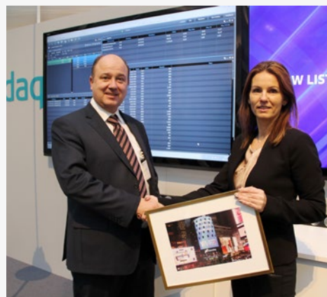
VA Automotive noteras på Nasdaq OMX First North i början av december 2014

Denna bokslutskommuniké är ej granskad av bolagets revisor.